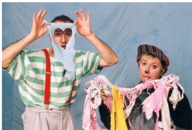
Victorius und die Maus Lizzy suchen den Waschlappendieb

Auch 2015 haben wir beim Weihnachtsgeschenk für die Kindergartenkinder die Hälfte der Kosten übernommen. Wie in den vergangenen Jahren stand der Besuch eines Theaterstücks von den „Stromern“ auf dem Programm. Nach den Weihnachtsferien war es Anfang 2016 dann soweit: Am 27.01.2016 sahen die Kinder das Stück „Der Waschlappendieb“ im Gemeindesaal der Andreasmairie .